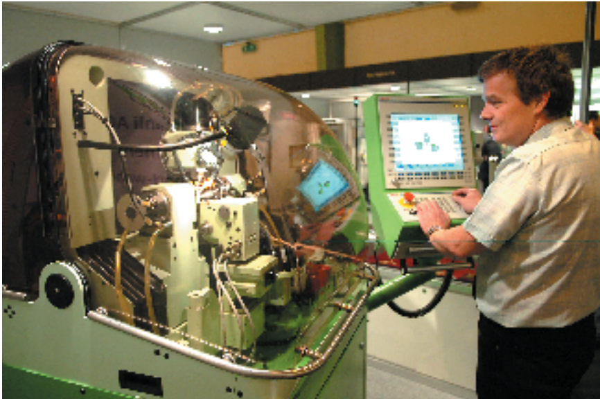
EPHJ 2005: des machines et du savoir-faire au service de l'horlogerie