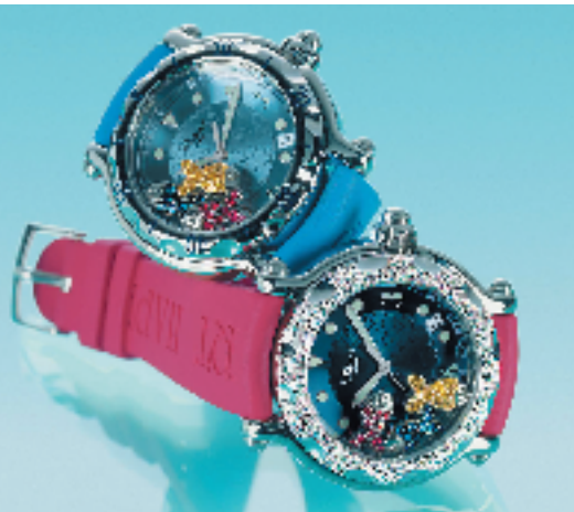
Modèles Happy Beach de Chopard avec des poissons dansants devant les aiguilles

Avant la mise en fabrication de pièces en or de très haute précision, cet horloger neuchâtelois a trouvé un moyen efficace et infaillible de programmer et simuler les opérations d'usinage sans casse ni perte de matière