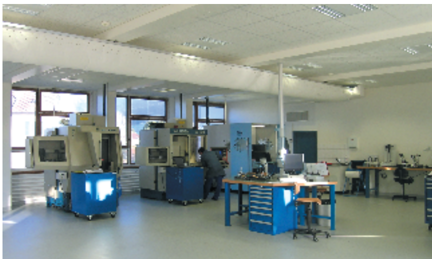
Un atelier laboratoire, où tout copeau paraît presque être un intrus. Une propreté et une rigueur à la mesure des défis que la manufacture Chopard s'est fixés.