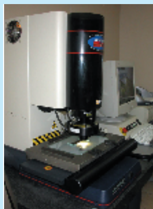
SmartScope 250 en opération chez APRP, Le Locle

dans la même catégorie que les plus chères des voitures de tourisme dont nous rêvons tous dans nos moments de faiblesse.